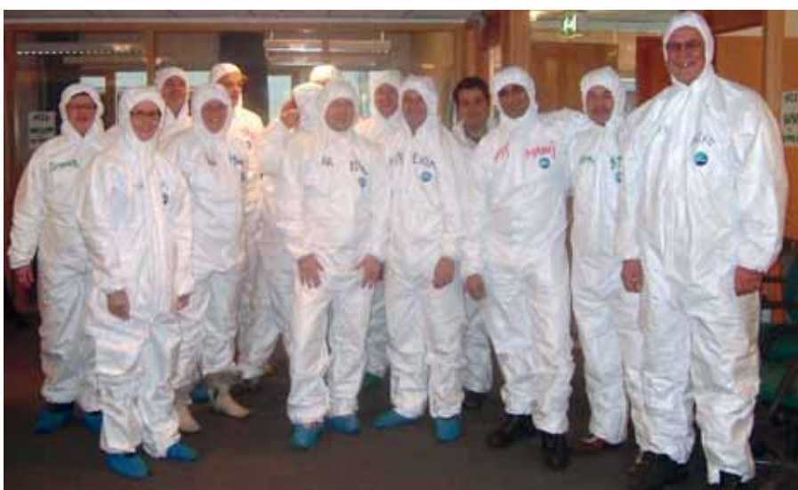
Ut på seminar i "månedress". Det var alt de ansatte visste og spenningen var stor før avreise